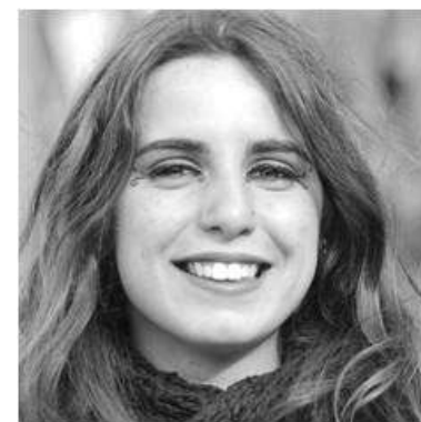
Bailarina e coreógrafa en Pangeia.

Na actualidade ven de producir en Rennes (Francia) o espectáculo "Si c'était ma rue" dentro do Festival Les Tombées de la Nuit.