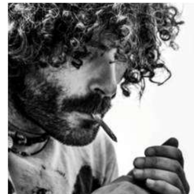
Actor e bailarín en Pangeia.