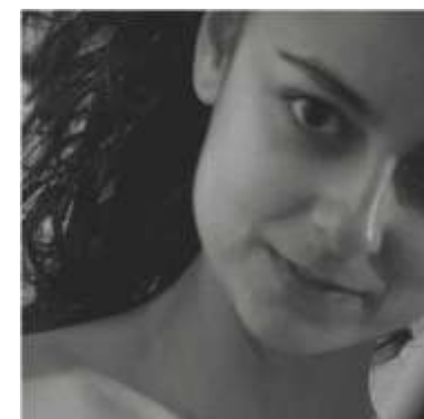
Bailarina e coreógrafa en Pangeia.