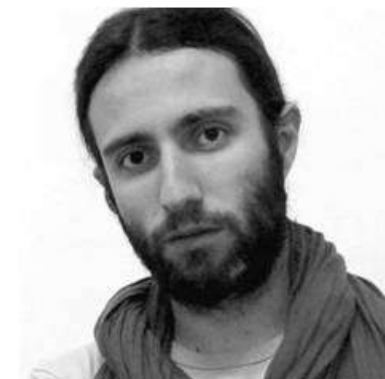
Actor e técnico en Pangeia.