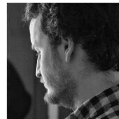
Actor e músico en Pangeia.

Graduado medio CMU Vigo especializada na gaita galega. Como músico escénico multinstrumentista músico pode tocar a guitarra , baixo, batería , madera , vento metal , plegables... Traballou en varias producción para compañía como Tranhallada, Non sí, o Fondo Galego de Cooperación, Lambriaca Prod, Matreska e Oito milímetros da que é fundador e na que dirixe e actúa. En 2007 gaña o premio como intérprete no 4º Certame de Teatro Inmediato en Gondomar. Actualmente combina traballos no teatro co audiovisual na TVG.